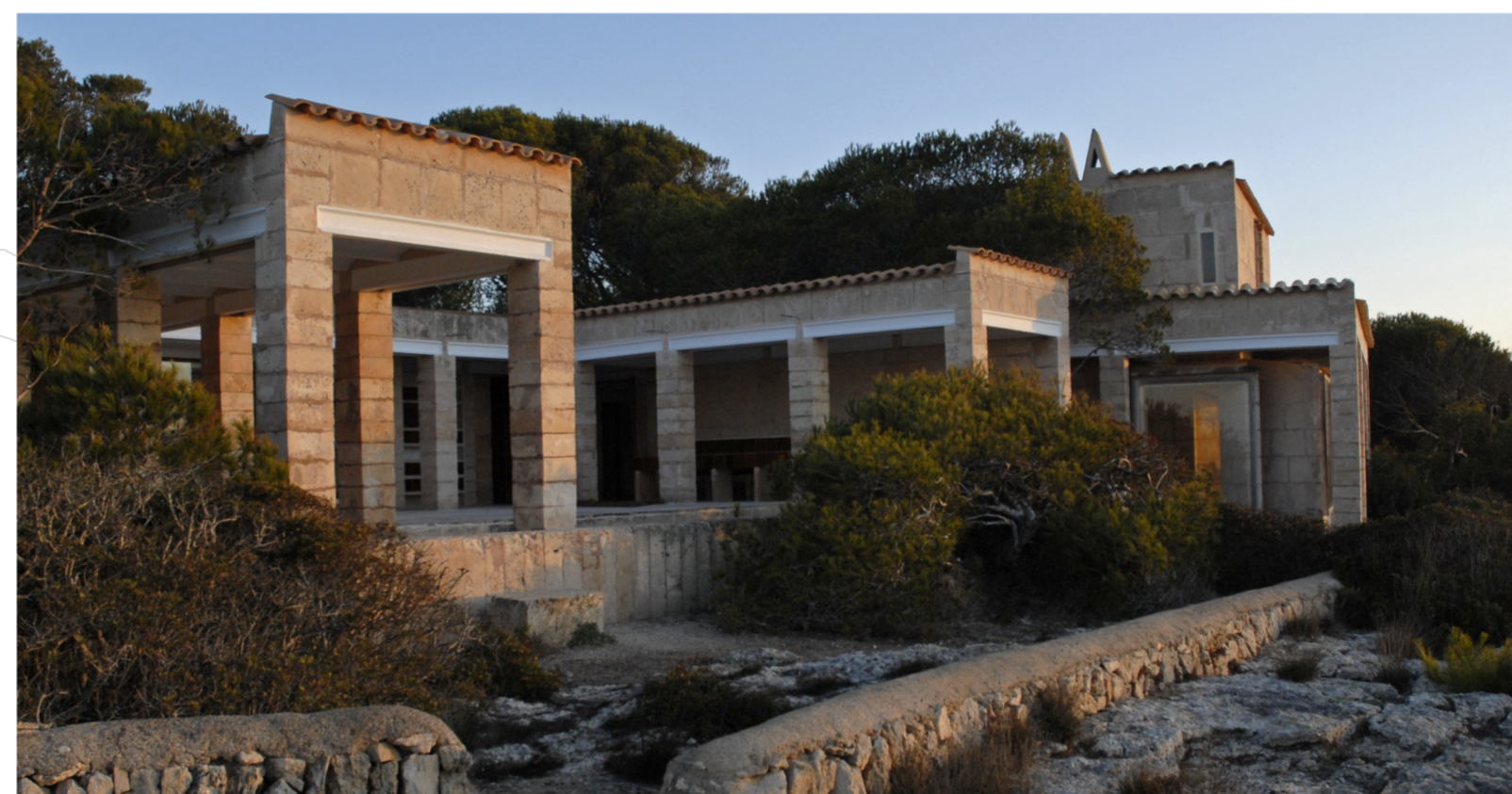
Can Lis abril 2012

Los Utzon llegaron a Mallorca a finales de la década de los '60. Entre 1970 y 1973 Utzon proyecta y construye can Lis. Posteriormente construye can Feliz, para mudarse una vez acabada en 1993. A partir de entonces la casa ha sido utilizada por hijos, nietos, invitados incluso alquilada, hasta que la Fundación Utzon la compra para convertir este espacio en un lugar para investigar, crear, escribir... sobre aquello que envuelve la casa, Utzon y el Mediterráneo.