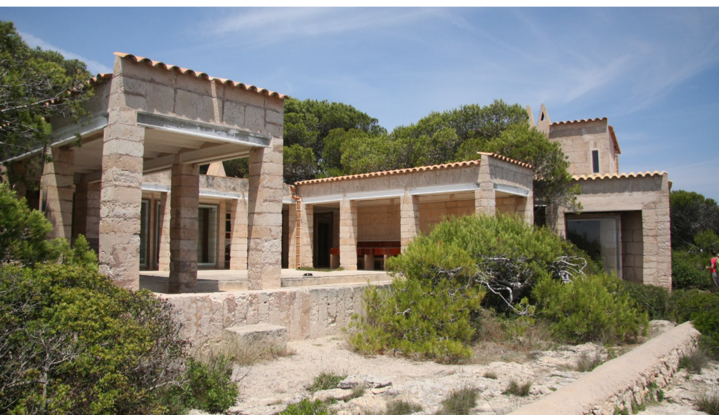
Can Lis septiembre 2011