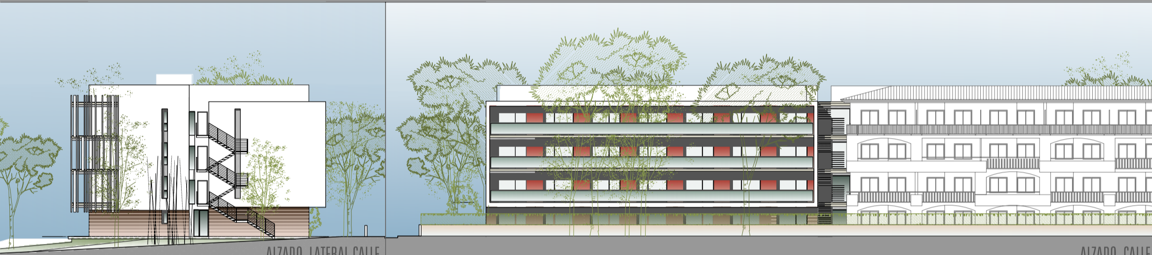
ALZADO LATERAL CALLE