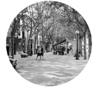
Passeig de les Rambles