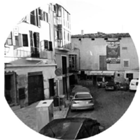
Costa de la santa creu