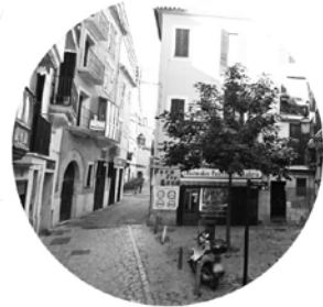
Carrer de Can Sales