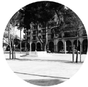
Porta de Santa Catalina

Racons proposats per la col·locació de les instal·lacions