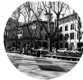
Passeig del Born