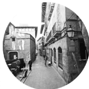
Carrer de Sant Feliu