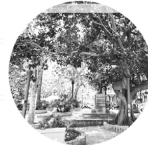
Plaça del mercat