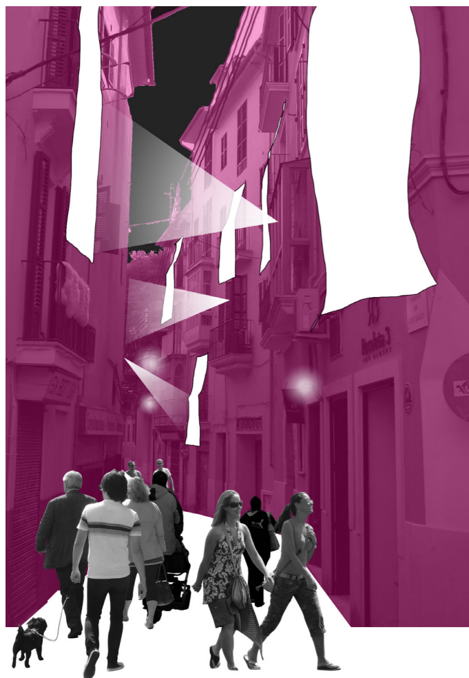
* collage del carrer Sant Feliu i de la plaça nº 3

Per obtenir la col·laboració dels ciutadans per oferir els seus balcons dels seus habitatges, es proposa realitzar una campanya de sensibilització, on s'explicarà el funcionament de la instal·lació, a través d'un tríptic informatiu i d'una explicació de caràcter personal.