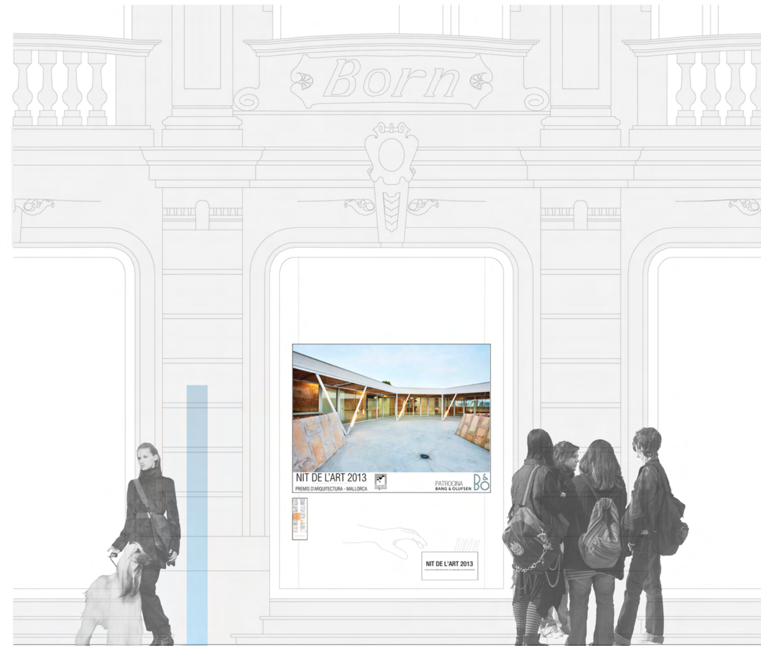
Alçat Aparador E: 1/40

10 aparadors al Born L'Exposició es distribuirà en 10 aparadors als dos costats del Born, de manera que molts comerciants tinguin l'oportunitat de participar amb el projecte i formar part de la Nit de l'Art de 2013