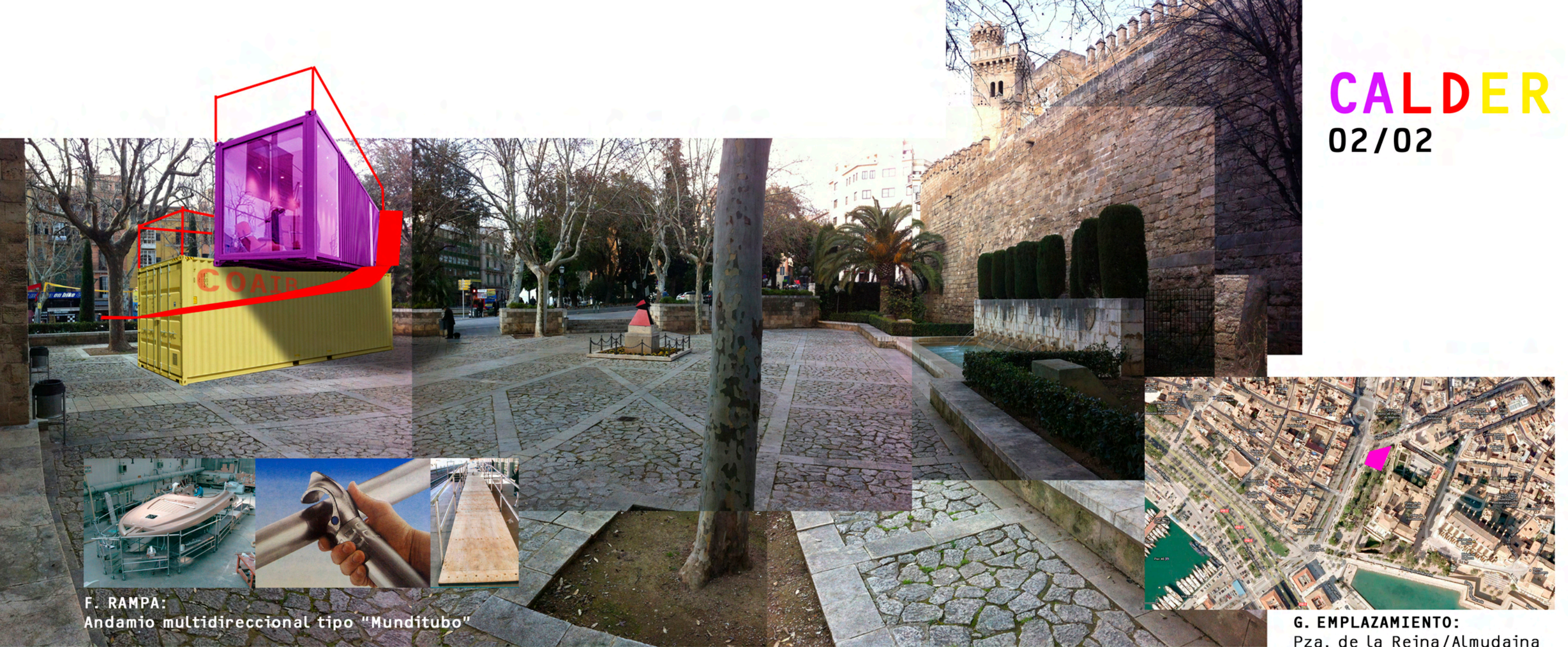
F. RAMPA: Andamio multidireccional tipo "Munditubo"