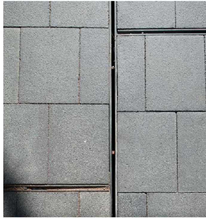
DETALL JUNTES TRANSVERSAIS