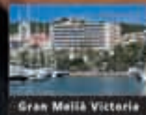
Gran Meliá Victoria

Sol Meliá con el Ciclo de Conciertos en los patios de Palma