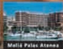
Meliá Palas Atenea