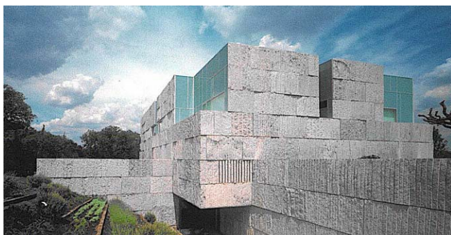
casa Las Encinas