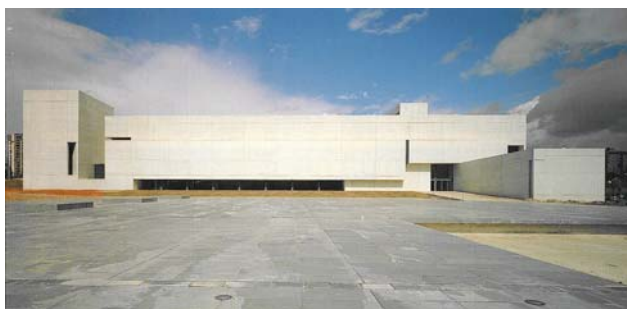
Facultat de Ciències Socials