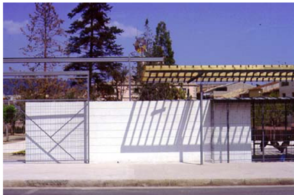
1988-1989 Parc a Artés FASE: REALITZAT