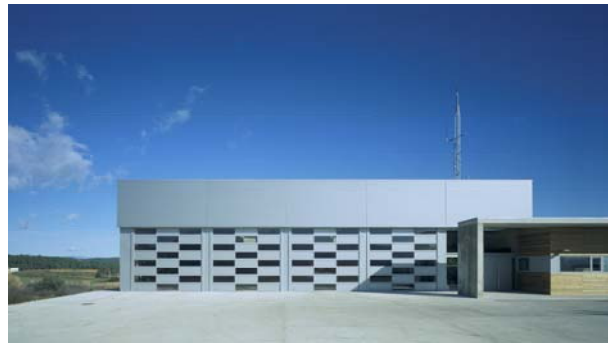
2000-2004 Parc de bombers a Banyoles PRIMER PREMI FASE: REALITZAT