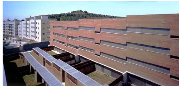
1993-1996 Habitatges a Gavà FASE: REALITZAT