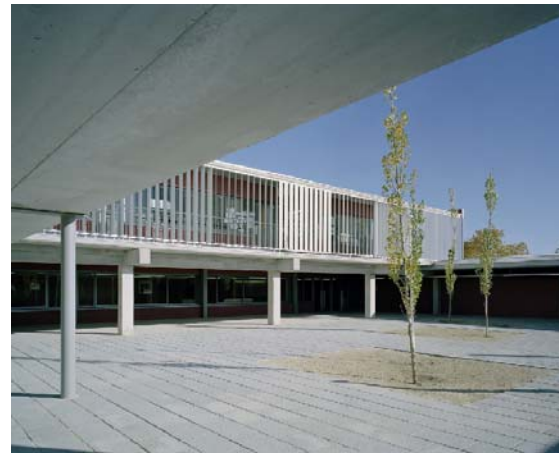
2004-2005 CEIP Maria Ossó a Sitges PRIMER PREMI FASE: REALITZAT