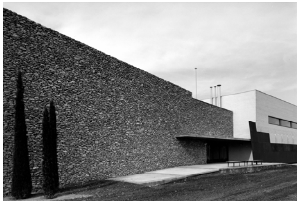
1991-1994 Escola a la Fuliola FASE: REALITZAT