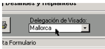
Zona inferior izquierda de la ventana de UP's.