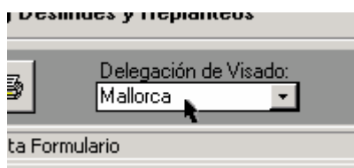
Zona inferior izquierda de la ventana de UP's.